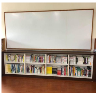
圖二 綜合教室討論空間