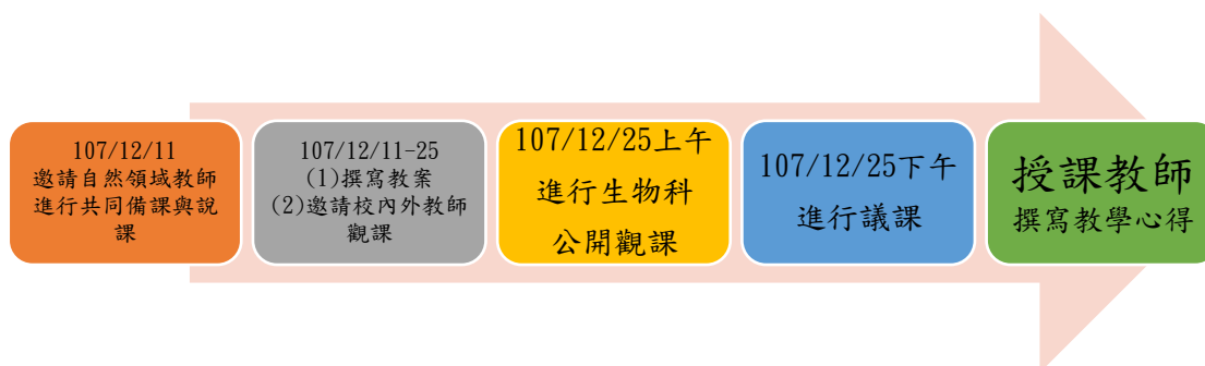
圖四 公開觀課辦理流程

本次公開觀課單元為國中七年級生物第五章生物體的協調作用，教師搜集數篇與該單元相關內容的閱讀教材，帶領學生利用辯證模式辨析文內資訊的正確性，結合資訊素養能進行資料查證，課堂間學生與教師互動熱絡，教師應用引導式提問，協助能力較弱的資優學生搭建鷹架，建立成功經驗。諮輔團隊教授與專家入校共同觀課，對於授課教師是很大的助益，同科及資優社群教師給予支持，將使未來課程發展更有著力點。