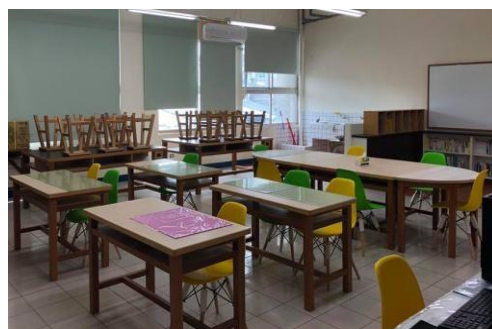
圖一 資優班綜合教室

討論課業。另外，教學設備擴增包含：討論桌椅、討論區白板及書櫃、多功能顯示器（圖三）……等。